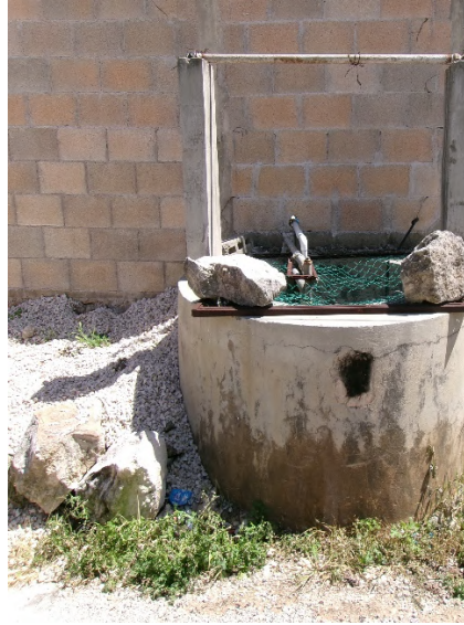
Calle 19 A x 19 y 21