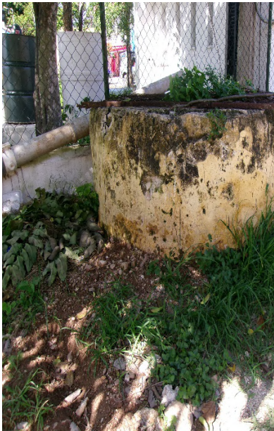
Calle 21 x 19 y 20