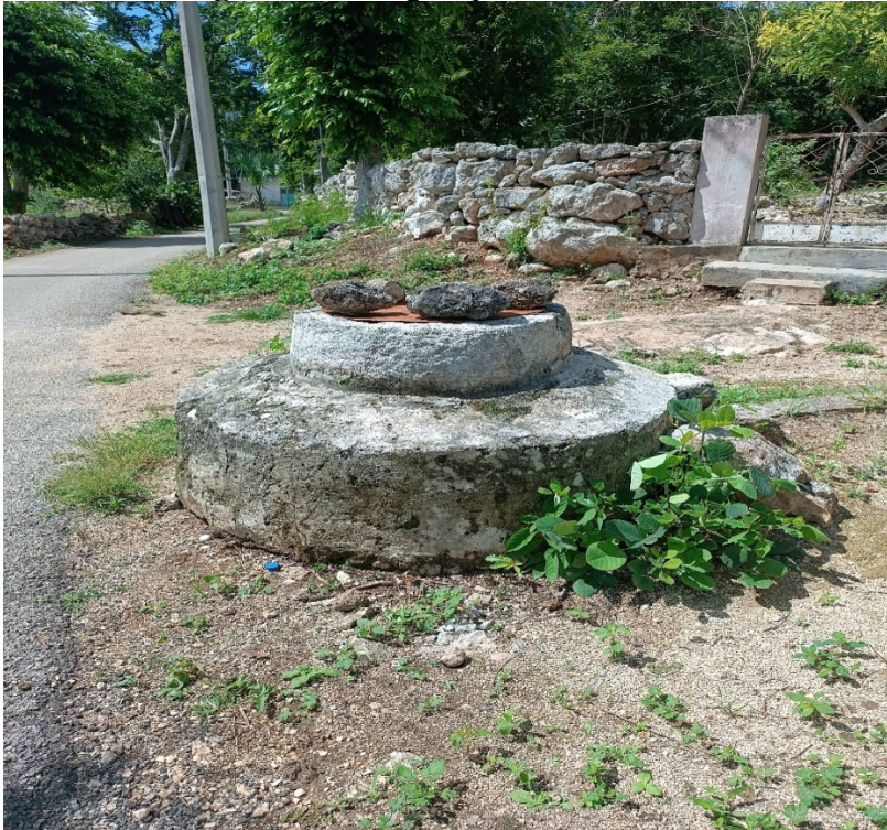
Figura 2. Antiguo pozo del pueblo