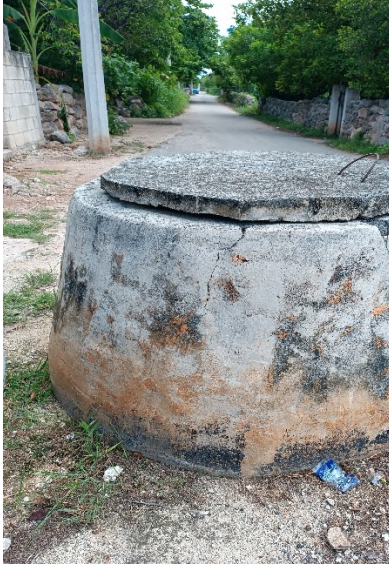
Calle 26 x 23 y 25