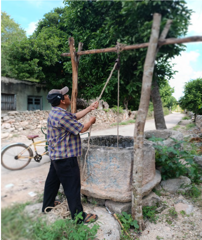
Grafico 4. Óox oochel. Páay ja'

Biin k'uchuk u k'iine' mina'anchajak ja'e' yaan u xuulul kuxtal. (il a wilej le óox oochela').