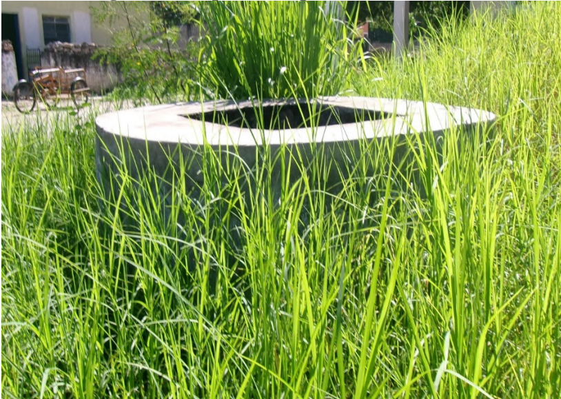
Figura 1. El pozo del pueblo de Kimbilá